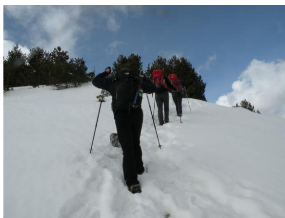
Uspon na Pelister