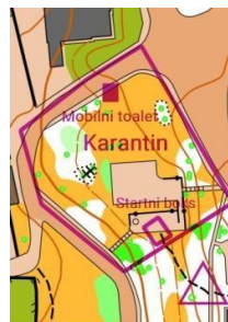
Скица 1. дан