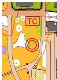
Скица 1. дан