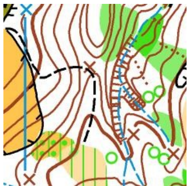
↑ Љиг, Београд