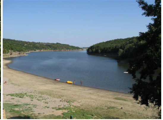
Bata apartmani na Bublčkom jezeru