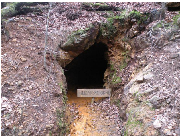
Napuštено rudarsko okno

Druga grupa od Đavolja varoši kreću do sela Đake pa do Prolom Banje preko Sokolovog visa. Dužina staze oko 14km sa visinskom razlikom od 700m. Staza je srednje težine preporučljiva i početnicima. Oko 18h stižemo u banju gde nakon pauze i osveženja nastavljamo putovanje ka Prokuplju i Belom kamenu. Prenoćište je obezbeđeno na Bublickom jezeru. Naveče uživanje kod Bate.