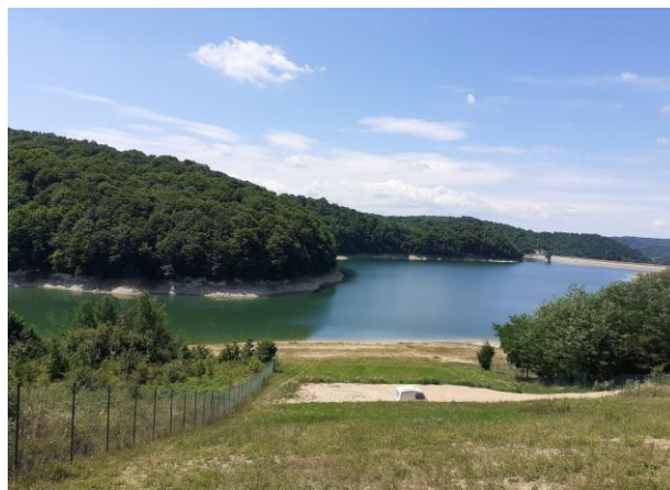
Поглед на Гарашко језеро