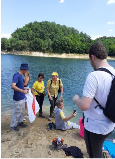
Одмор на Гарашком језеру